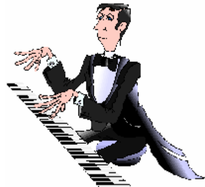
Le pianiste – la pianiste

Nous admirons notre boulanger. Nous admirons notre boulangère. Mon papa est un ouvrier. Notre maman est une ouvrière.