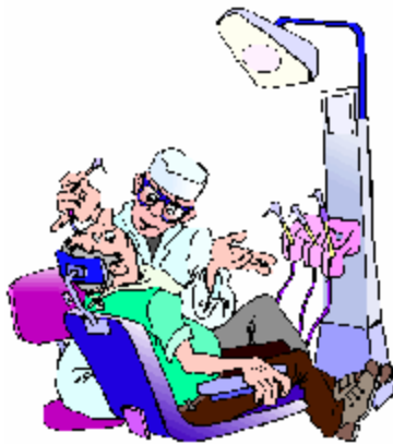
Un dentiste – une dentiste

Pour écrire un nom masculin au féminin, tu dois ajouter la lettre « e ». Certains noms communs ne changent pas ni au masculin ni au féminin, seul le déterminant change.