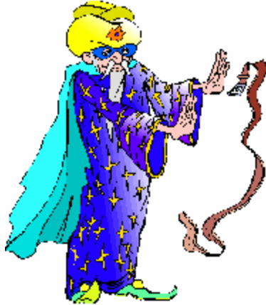
Le magicien – la magicienne

Les noms communs qui se terminent par »ien « changent en « ienne ». Attention : ne pas oublier les deux « n ».