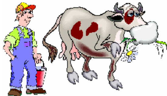
Le fermier – la fermière