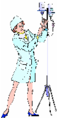
Une infirmière – un infirmier

Les noms communs qui se terminent par « er » changent en « ère » Attention : ne pas oublier l'accent grave.