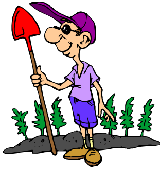
dans le jardin