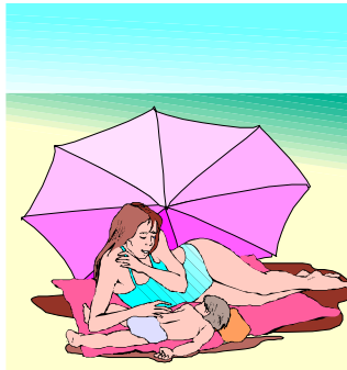
sous le parasol