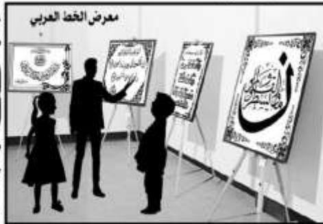
معرض الخط العربي

أجابته أحمد موضحاً: "هذه لوحات بها آيات قرآنية كتبت بالخط العربي المزخرف". فعقب "مايكل": "آه... هذه إذن ليست رسوماً، وإنما عبارات لها معان". تدخلت فاطمة وقالت: "إن سمحت، سيدي، سنعرفك بهذه الآيات وبديننا الإسلامي الحنيف".