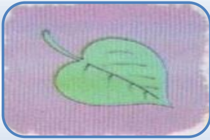
ورقة على شكل رمح