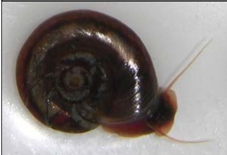
حلزون Biomphalaria glabrata