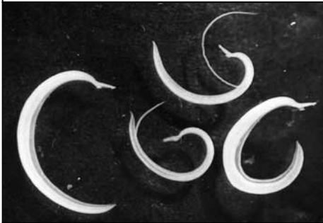
دودة خيطية = البلهارسيا Schistosoma intercalatum