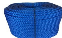
Corde en polyéthylène (PE)

Pour vérifier Le papier est un matériau organique, on réalise l'expérience schématisée ci-dessous :