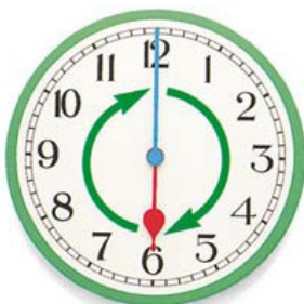
مسار عقرب الساعة دائري