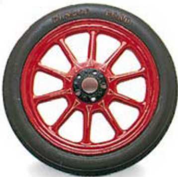
حركة العجلة حركة دوران حول مركزها