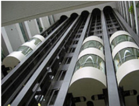
حركة المصعد حركة إزاحة مستقيمية