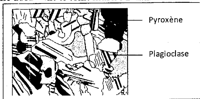
Schéma interprétatif de l'observation microscopique de la roche ①

Le document ci-joint illustre 2 lames minces de roches vues au microscope polarisant.