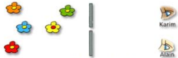
Fig. 1 : Que voit-on ?