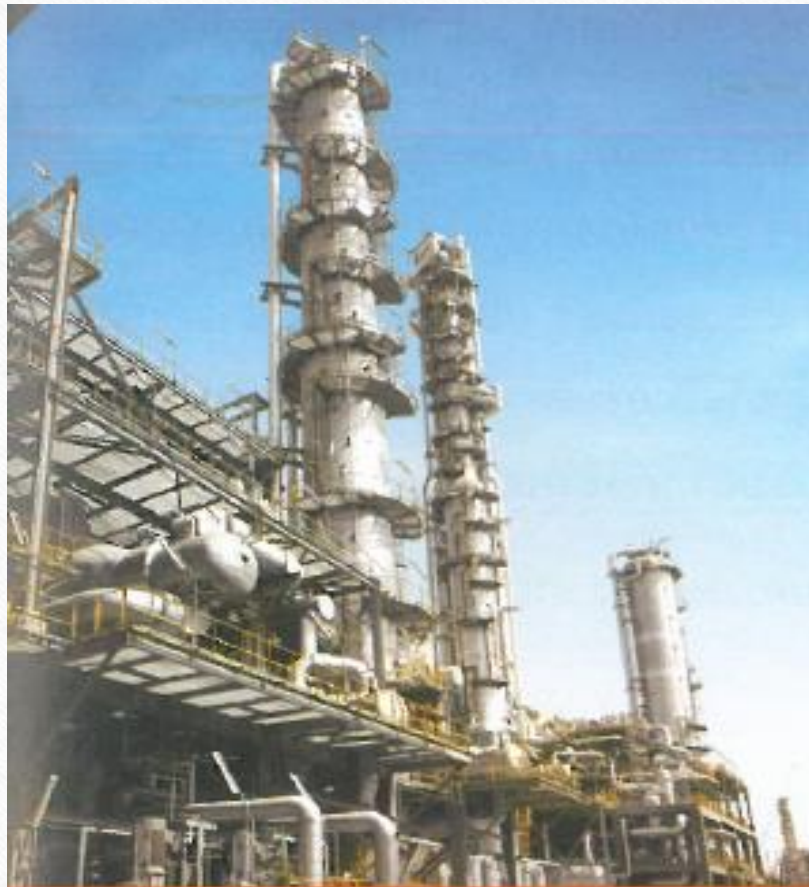
Une tour de distillation