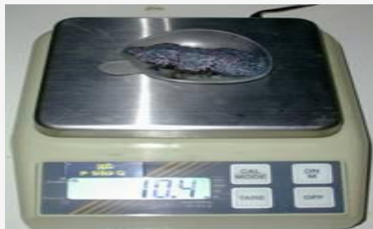
Solide noir grisâtre poreux et friable