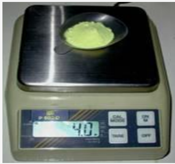
Pesée du soufre