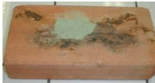
Sur une brique, on place le mélange