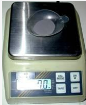
Pesée du fer