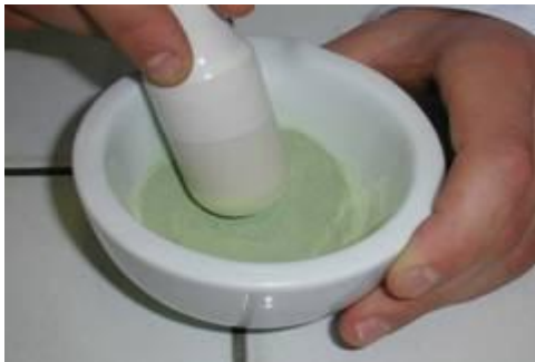
Mélange fer-soufre dans un mortier