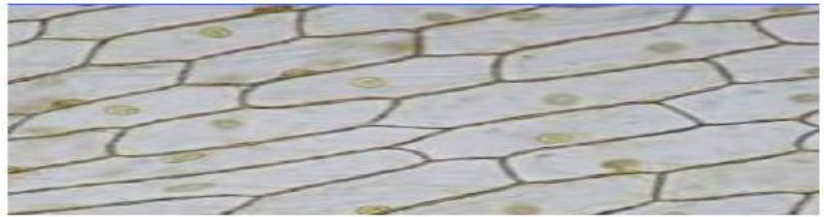
Doc2 : observation microscopique d'un être vivant

Des élèves ont réalisé des observations d'un être vivant au microscope optique. L'image ci contre montre ce qu'ils ont observé.