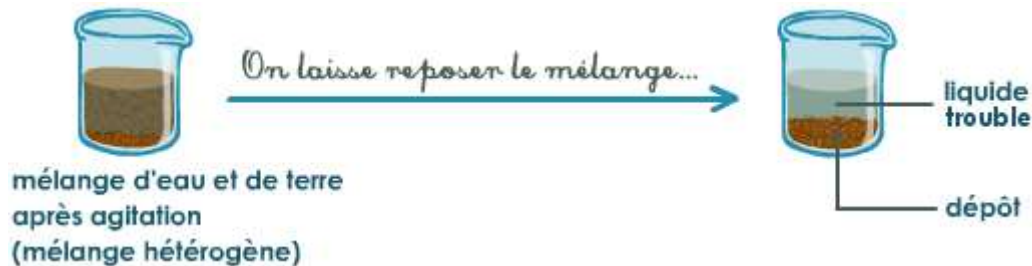
Doc. 1. Principe de la décantation.

La décantation consiste seulement à laisser reposer le mélange (doc. 1.) :