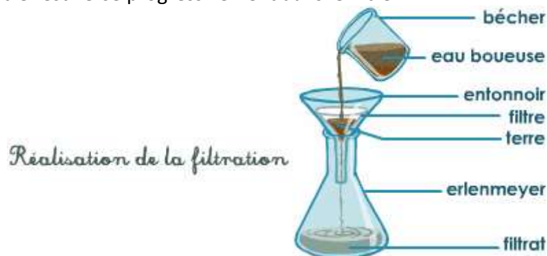
Doc. 3. Principe de la filtration.

Le mélange à filtrer est versé progressivement dans le filtre :