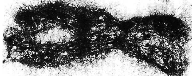
لاحظ بنية الصبغي الاستوائي.

الصبغة الصبغية: تعبر عن عدد الصبغيات وهي ميزة نوعية قد يرمز لها ب 2n أو ب n (أحادية أو ثنائية). الهستون: مكون من مكونات الخييطات النووية وهو عبارة عن بروتين يرتبط به خييط ADN ليعطي مظهر عقد اللؤلؤ للخييط.